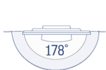
Weitwinkeldisplays von höchster Qualität